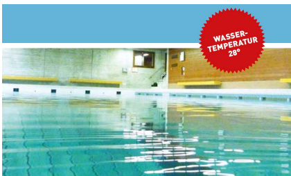
Öffentliches Hallenbad Kleinhüningen

Samstag 10 – 12 Uhr (nur Frauen, Kinder haben keinen Zutritt) Samstag 12 – 17 Uhr Sonntag 10 – 17 Uhr