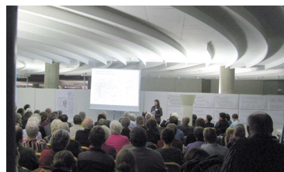
Informationsveranstaltung zum Bauvorhaben «Schorenstadt»

brunnenquartiers, nahmen teil. Nach Referaten zum Planungsstand aller drei Baufelder wurden in Gruppen die Projektentwürfe kritisch besprochen. Besonders gefallen hat die an der 2000-Watt-Gesellschaft orientierte Planung. Kontrovers diskutiert wurden die Fragen rund um Parkplätze und öffentlichen Verkehr.