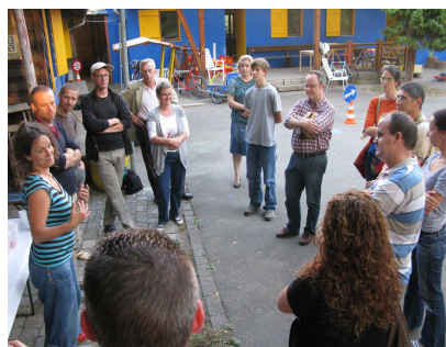
Eltern auf einem Rundgang beim Robi Horburg

Der Elternrundgang wird von speziellen Pausenhof-Aktionen flankiert, bei denen 15 Organisationen ihr Angebot während der 10-Uhr-Pause auf dem Schulhof den Kindern interaktiv vorstellen.