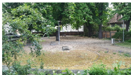
Grünanlage am Wettsteinhäuschen

Aufwertung der Grünanlage gesammelt wurden, sind nun in einen ersten Entwurf eingeflossen und werden dann den Interessierten vorgestellt. Mehr Infos folgen: https://stskb.ch/news/